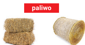
Słoma w kostkach - RED PLUS AGRO Słoma w belach - RED PLUS AGRO B