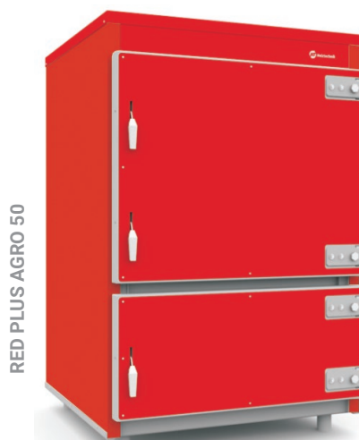
RED PLUS AGRO 50